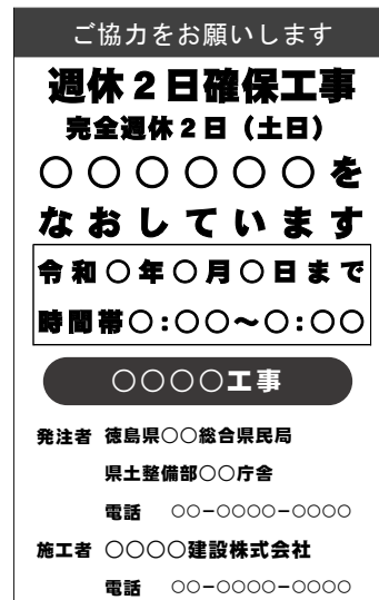
（標示板記載例）完全週休2日（土日）の場合